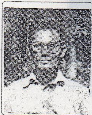
သခင်ချစ်