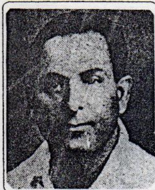
ရဲဘော်ဘတင်