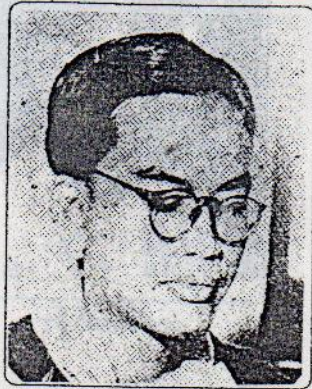
သခင်သိန်းဖေ