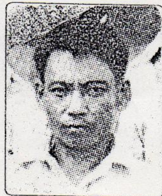
ရဲဘော်ဌေး