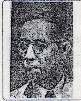
သခင်လှဇေ(ဇိုလ်လကျာ)