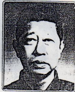
သခင်ဗသိန်းတင်