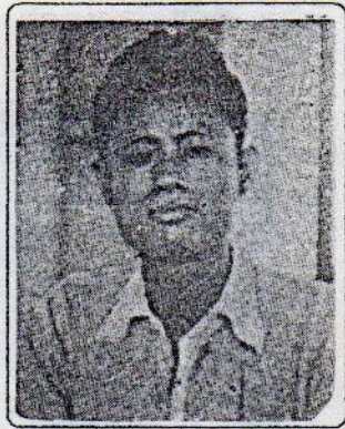
သခင်အောင်ဆန်း

ပါတီစတင်ထူထောင်ခဲ့သည့်အစုဝင်ရဲဘော်အချို့