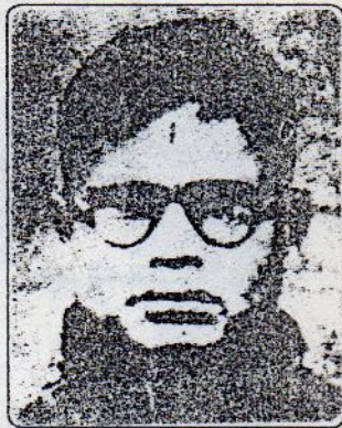
သခင်စိုး