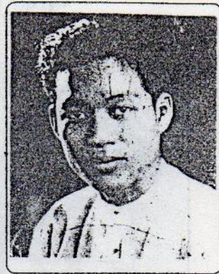
သခင်ဗဟိန်း