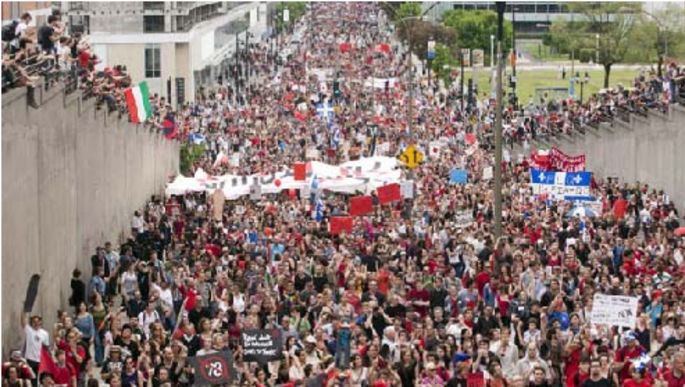
ကနေဒါကျောင်းသားနဲ့ပြည်သူများ

ဒီဇယားကို ကြည့်ရင် မဲပေးသူရာခိုင်နှုန်းဟာ ၆၀% အောက်မှာပဲဆိုတာ တွေ့ရမှာပါ။ ဒါတောင် ၂၀၀၈ နဲ့ ၂၀၁၂ မှာ အိုဘားမား (ပထမဆုံးလူမည်း) ဝင်အရွေးခံလို့ လူစိတ်ဝင်စားမှု ပိုလာပြီး ရာခိုင်နှုန်းတက်လာတာ ဖြစ်ပါတယ်။