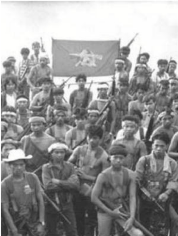
NPA တပ်ဖွဲ့ဝင်များ

• NPA ဟာ အော်တိုမက်တစ်ရိုင်ဖယ်သေနတ် ကိုင်ထားကြတဲ့ အချိန်ပြည့်တပ်သား ထောင်အချို့ရှိသလို၊ အရေအတွက်ပိုမိုများပြားတဲ့ ဒေသခံပြောက်ကျား အင်အားစုများ၊ ပြည်သူ့စစ်များနဲ့ ခေတ်မီတော့တဲ့ လက်နက်များတပ်ဆင်ထားကြတဲ့ ကိုယ့်ကိုယ်ကို ကာကွယ်ရေးတပ်များလဲ ရှိပါတယ်။ ၁၉၈၃ နှောင်းပိုင်းမှာ CPP သစ် ခေါင်းဆောင်တဲ့ NPA ဟာ လက်နက်ကိုင်အင်အား ၁ သောင်း ၂ ထောင်ကျော်ထိ ရှိလာပြီး ဒီလစ်ပိုင်တပ်ပြည်လုံး ပြည်နယ် (၇၃) ခုရှိတဲ့အနက် ပြည်နယ် (၆၄) ခုမှာ လှုပ်ရှားပြီး ပြည်သူ့ပြောက်ကျားစစ်ပွဲကို ဆင်နွှဲနိုင်ခဲ့တယ်။