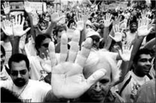
ဂျီနီအာထိပ်သီးညီလာခံကိုဆန့်ကျင်ဆန္ဒပြနေကြသူတွေ

၁၉၄၈ခုနှစ်နောက်ပိုင်း ဗမာပြည်အုပ်စိုးသူလူတန်းစား အဆက်ဆက်ဟာ သူတို့ရဲ့ ဗျူရိုကရက်လူတန်းစား အရင်းအနှီးများ ဖွံ့ဖြိုးတိုးတက်ရေးကိုသာ ဆောင်ရွက်ကြတာချည်း ဖြစ်ပါတယ်။ မင်းပြောင်းမင်းလွဲလုပ်တိုင်း ကိုယ့်အသိုင်းအဝိုင်းထဲကလူတွေနဲ့ ဗျူရိုကရက် အရင်းအနှီးကို ထူထောင်နေရတာမို့ ပြည်သူတွေခံစားနိုင်တဲ့ နိုင်ငံတော်ရဲ့ အရင်းအနှီးနဲ့ အမျိုးသားခန့်ရှင်များရဲ့ အရင်းအနှီး ဆိုတာတို့ဟာ ထောင်တက် လာတယ်လို့ကို မရှိခဲ့ပါဘူး။ ရှင်းအောင်ထပ် ပြောရရင် ဒီနိုင်ငံမှာ အုပ်စိုးသူစစ်အုပ်စုကို ကပ်ရင်ကပ်၊ မကပ်ရင် စီးပွားရေး မဖြစ်ထွန်းနိုင်ဘူးဆိုတဲ့ အခြေအနေ ရောက်အောင် တမင်ဖန်တီးထားပါတယ်။