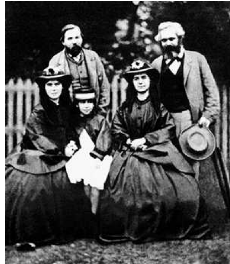
အိန်ဂယ်လ် ဓာတ်ပုံ ဓာတ်ပုံနီးနှင့် သမီးနှစ်ဦးပုံ။

ကွယ်လွန်ပြီးတဲ့ နောက်မှာတော့ ကျန်းမာရေးပြန်ကောင်းရေးဆိုတဲ့ ပင်ပန်းခက်ခဲလှတဲ့ ခရီးရှည်ကြီးကို နှင်ရရှာပါတယ်။ သူက သူ့အလုပ်ကို အဆုံးသတ်သေးချင်တာကိုး။ သူဟာ သူ့ကိုယ်ပေါ်မှာ သူ့အဖေရဲ့ပုံ၊ ကျမအမေရဲ့ ဓာတ်ပုံဟောင်းလေးတပုံနဲ့ (မှန်ဘောင်သေးသေးလေးထဲမှာ) ကျမအမေ ရုပ်နီတို့ရဲ့ပုံတွေကို အမြဲဆောင်ထားပါတယ်။ သူကွယ်လွန်တော့ အဲဒီပုံတွေကို သူ့ရင်ဘတ်က အိတ်ထောင်ထဲမှာ တွေ့ကြရပါတယ်။ အိန်ဂယ်လ်က အဲဒါလေးတွေကို သူ့ခေါင်းထဲမှာ ထည့်ပေးလိုက်ပါတယ်။ ။