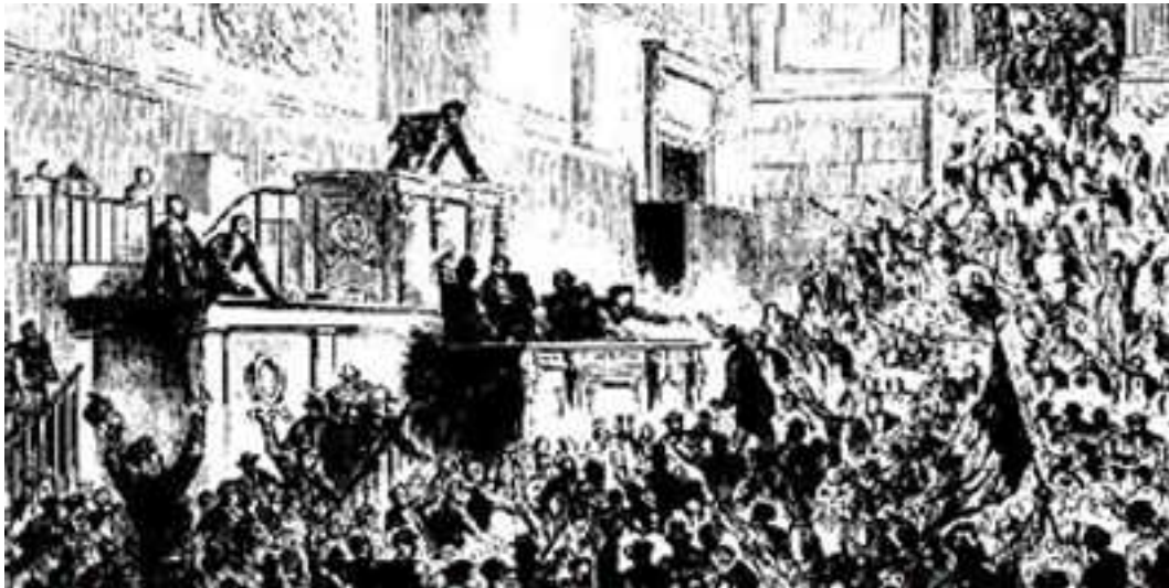
ပြင်သစ်ဘုရင်အုပ်စိုးမှုအား ပြည်သူများက စွဲချက်တင်နေကြစဉ်

ပထမကမ္ဘာစစ်လိုပဲ စစ်ပွဲတွေပြန်ဖြစ်ပွားနေပါတယ်။”